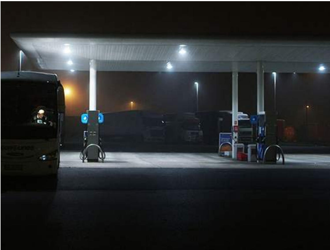
Référence visuelle pour la station service de la séquence 3 et 4.