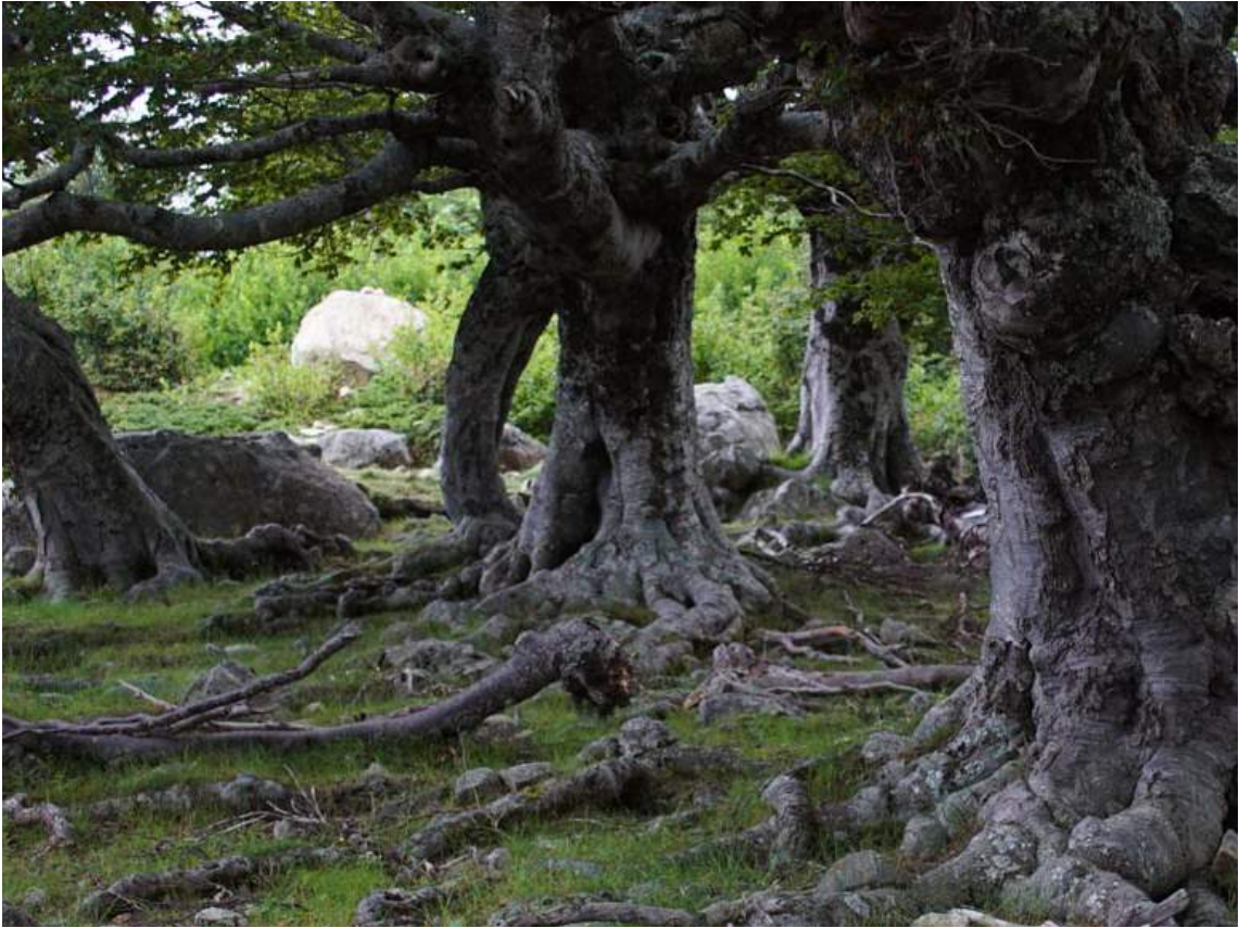
Référence visuelle pour la forêt de la séquence 5.