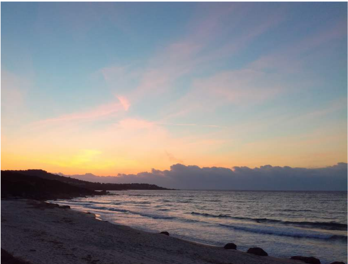
Référence visuelle pour la plage de la séquence 6.