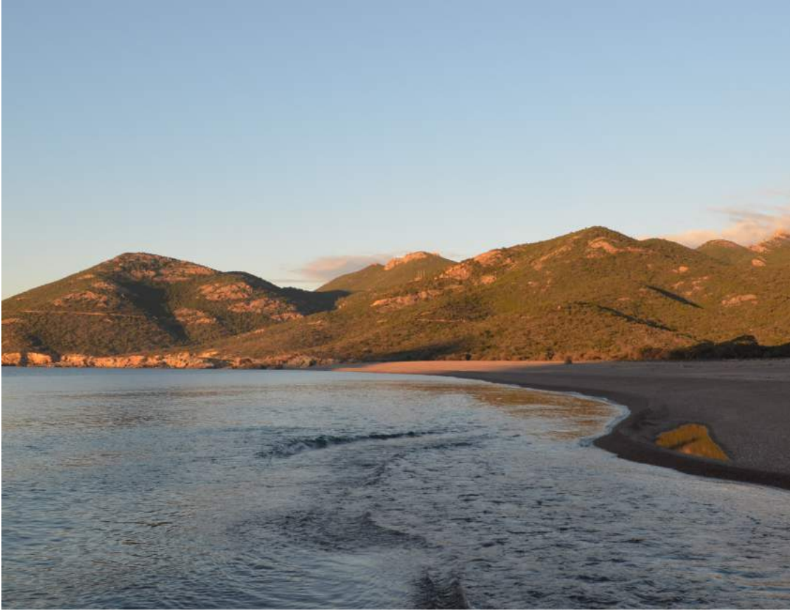
Référence visuelle pour la plage de la séquence 1 et 2.