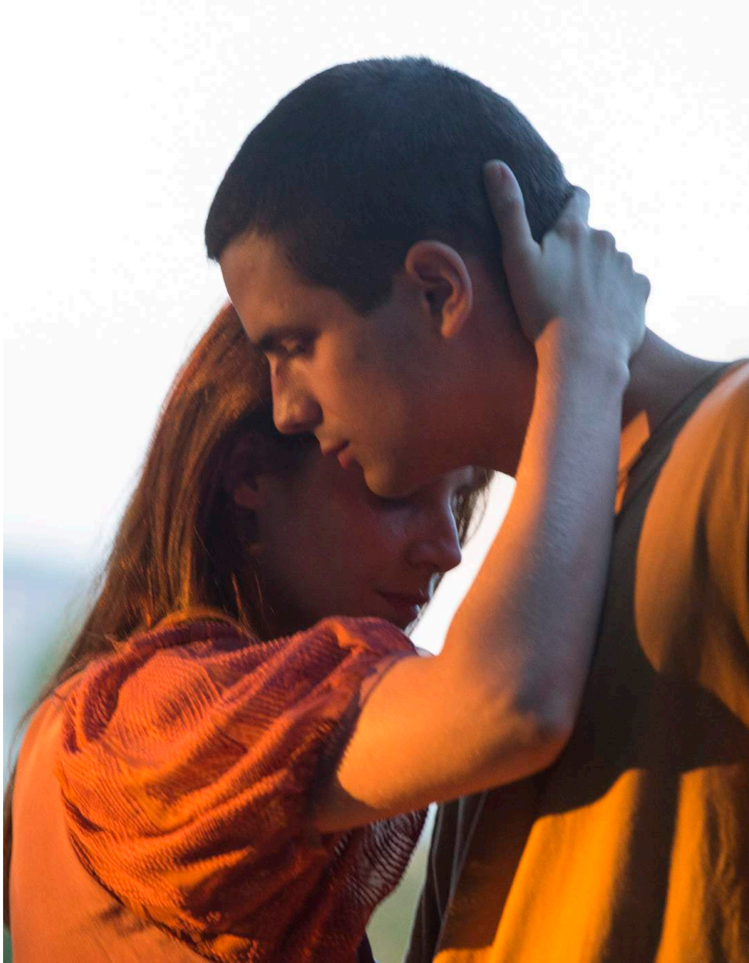
Vif-argent (2019) de Stéphane Batut.